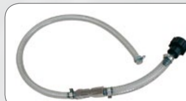
External suction hose (on request)