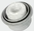
AdBlue® long life 3D Filter