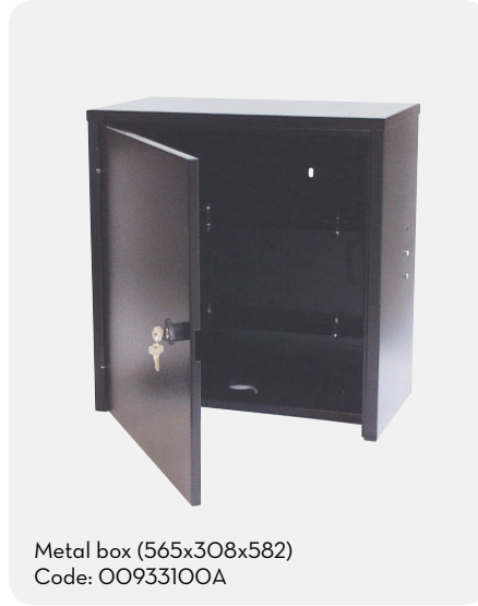
Metal box (565x308x582) Code: 00933100A