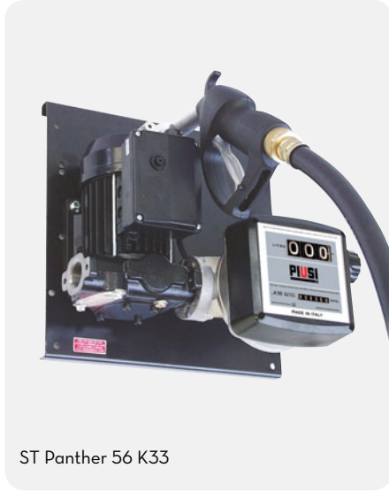
ST Panther 56 K33